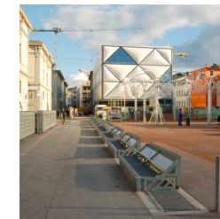
Le Flon, Lausanne