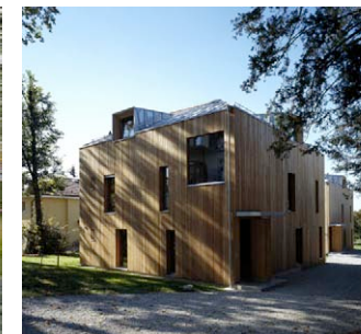
Ensemble d'habitation, Prilly L-architectes

Mercredi 1 er avril 2009 à 13 h 30 Ecole polytechnique fédérale de Lausanne, Polydôme