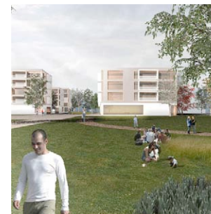
Quartier Commune-Borgeaud, Gland Lopes & Périnet-Marquet architectes In Situ architectes-paysagistes