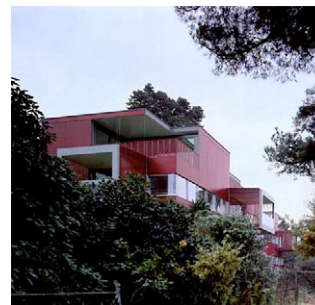
Villas plurifamiliales Vitkon burkhalter sumi architekten